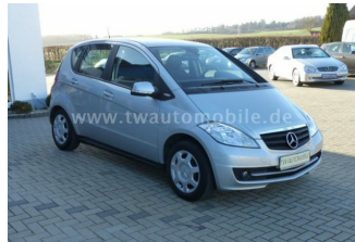
Neu & Gebrauchtfahrzeuge aller Marken