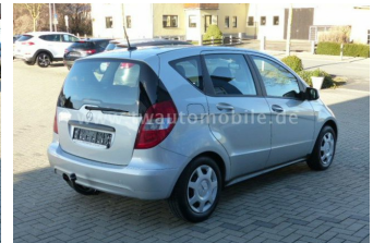
Neu & Gebrauchtfahrzeuge aller Marken