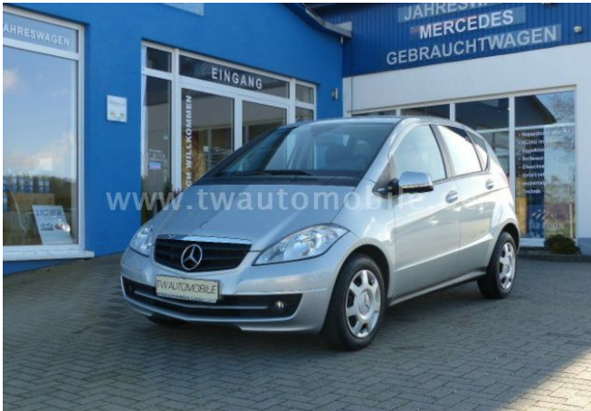
Neu & Gebrauchtfahrzeuge aller Marken