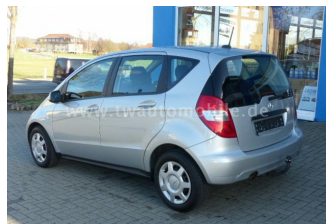
Neu & Gebrauchtfahrzeuge aller Marken