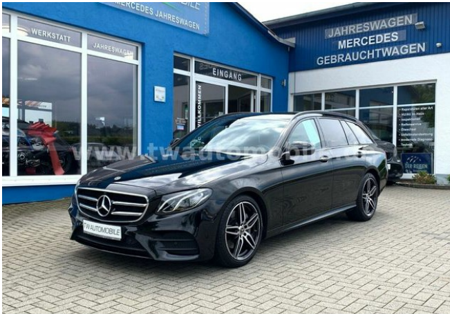
Neu & Gebrauchtfahrzeuge aller Marken