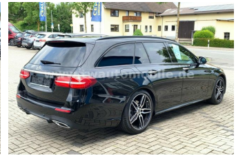
Neu & Gebrauchtfahrzeuge aller Marken