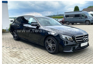
Neu & Gebrauchtfahrzeuge aller Marken