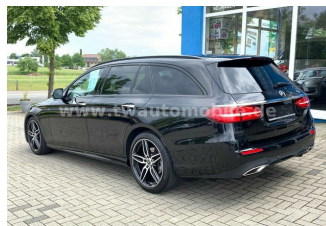
Neu & Gebrauchtfahrzeuge aller Marken