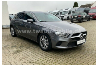
Neu & Gebrauchtfahrzeuge aller Marken