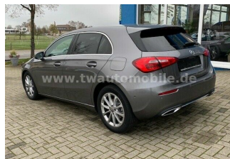
Neu & Gebrauchtfahrzeuge aller Marken