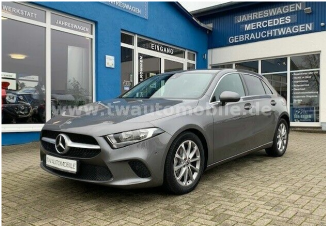
Neu & Gebrauchtfahrzeuge aller Marken