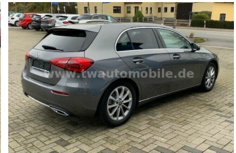
Neu & Gebrauchtfahrzeuge aller Marken